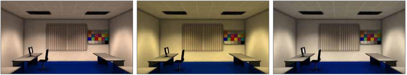
Figure 3: 그림 3: 세 가지 스펙트럼을 사용한 사무실의 사실적 렌더링 비교: (a) 5000K 흑체 스펙트럼, (b) 조명기 설계에 사용된 램프의 5000K 형광 스펙트럼, (c) 5000K 백색 형광체 LED

조명이 켜진 공간의 모양과 느낌을 이해하기 위해 사무실의 PRR 이미지를 형광등 광원으로 만들었습니다(그림 3b). 그런 다음 비교를 위해 5000K 흑체 스펙트럼(그림 3a)과 5000K 백색 형광체 LED 스펙트럼(그림 3c)을 사용하여 소스를 다시 추적하고 다시 렌더링했습니다. 각 장면에서 빛 자체를 보면 '백색'으로 보입니다.