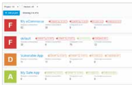
基于安全漏洞状态的项目安全等级。