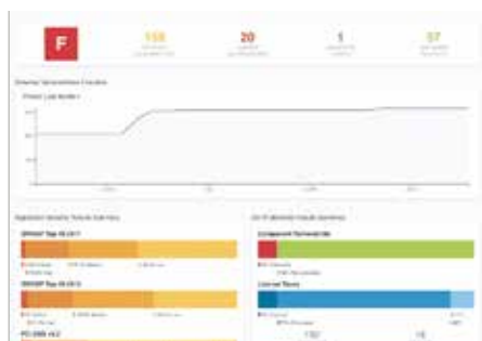
顶级安全漏洞的综合仪表盘视图。